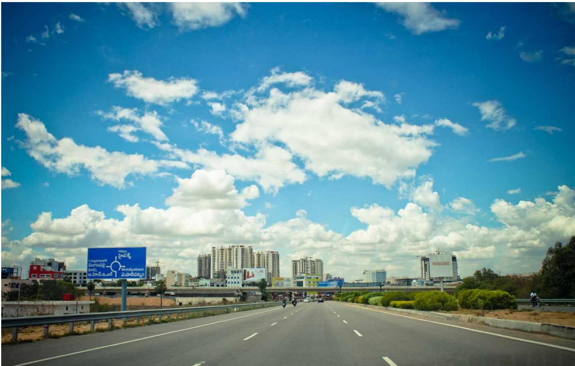
Yeni texnologiyalar şəhəri və ticarət mərkəzləri