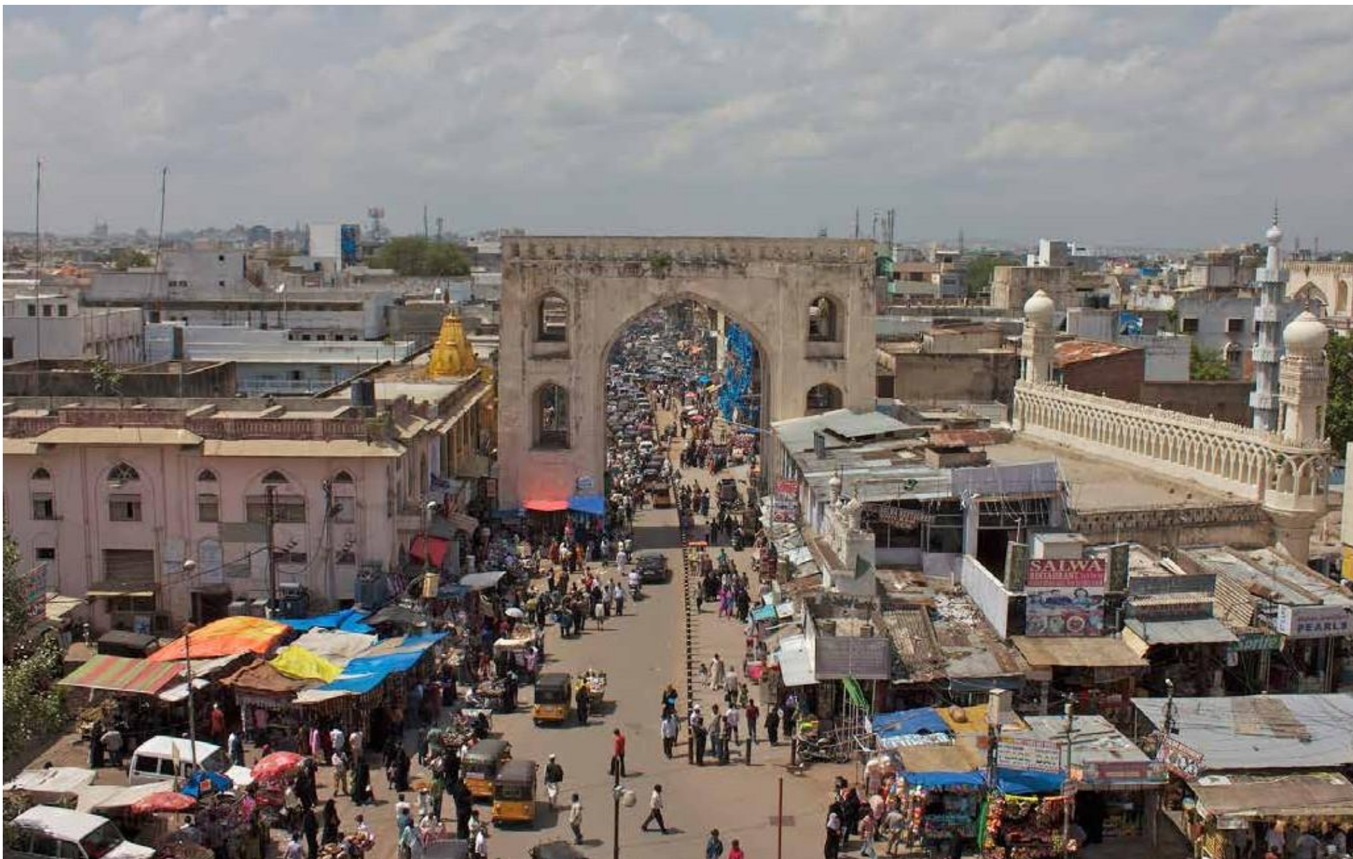
Köhnə şəhər - Heydarabad, Hindistan