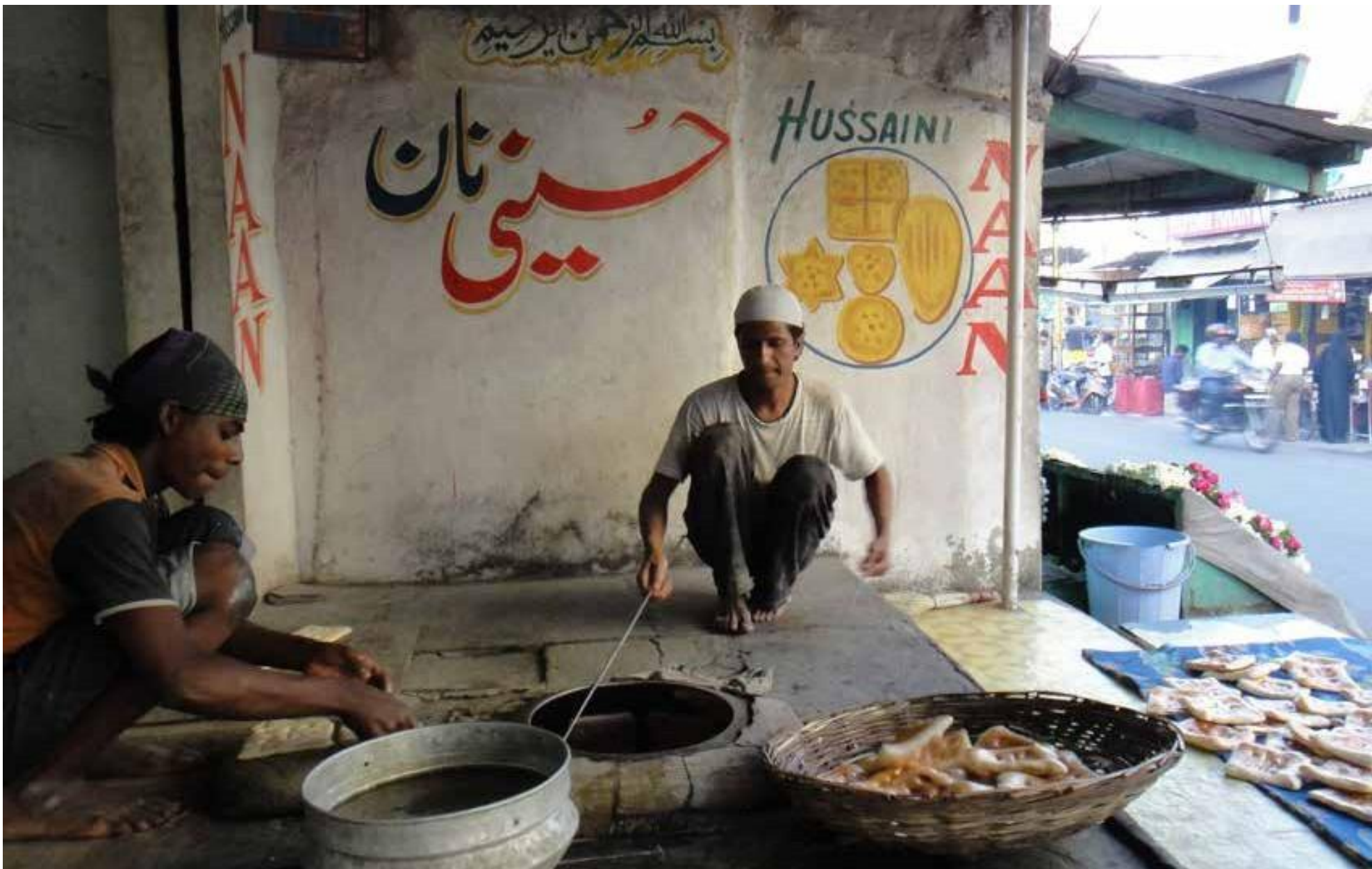
Köhnə şəhər - Heydarabad, Hindistan