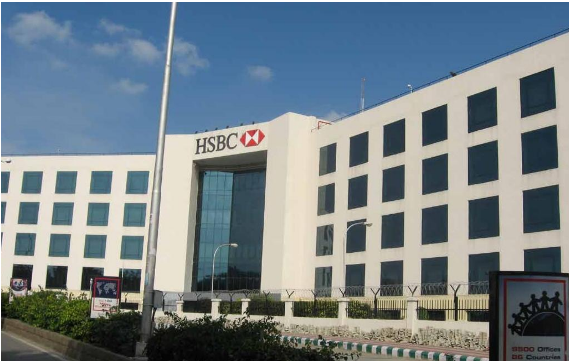
Yeni texnologiyalar şəhəri və ticarət mərkəzləri

Mənə: https://www.flickr.com/photos/listenersvision/5782124788