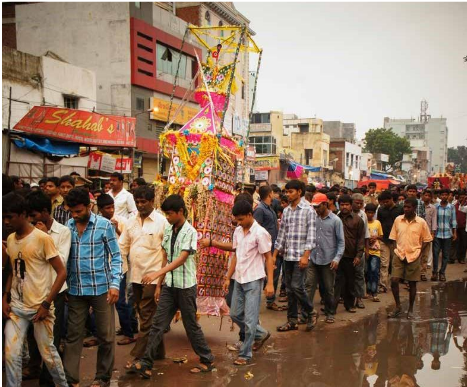
Köhnə şəhər - Heydarabad, Hindistan