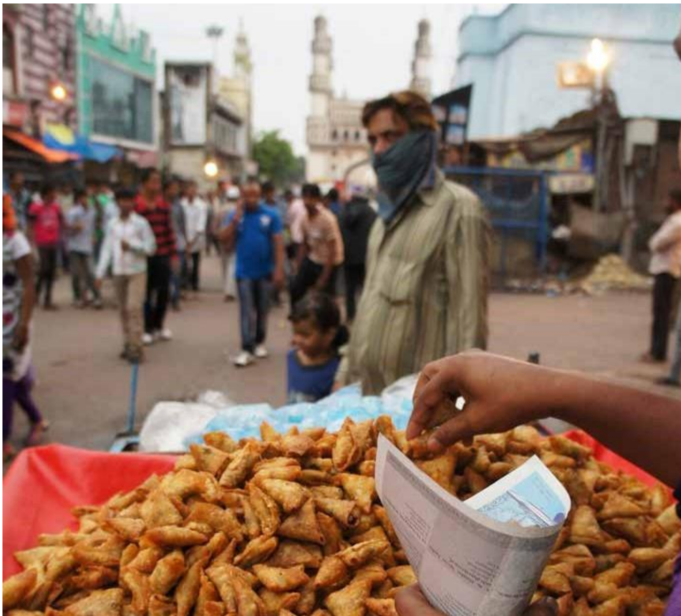
Köhnə şəhər - Heydarabad, Hindistan