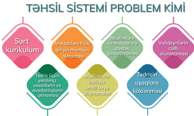
Əlilliyin Sosial Modeli

Nəzərə almaq lazımdır ki, əlilliyi olan uşaqların təhsilə çıxışını və iştirakını məhdudlaşdıran maneələri aradan qaldırmaqla təhsil sistemini hamı üçün əlçatan etmiş olur. Inklüziv məktəb hamı üçün yaxşı və keyfiyyətli məktəb deməkdir.