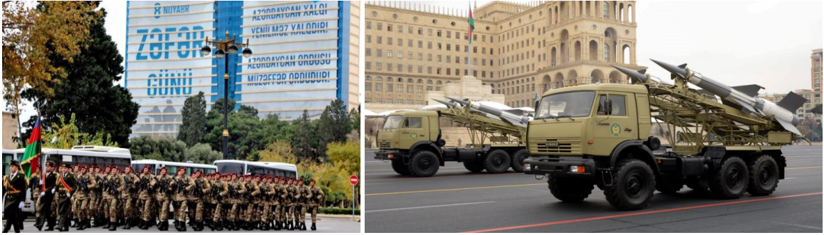
Azadlıq meydanında Zəfər paradı 10 dekabr 2020-ci il

iqtisadi-coğrafi mövqe buraya xarici investisiyaların axınına imkan yaratdı. Azərbaycanın iqtisadiyyatına milyardlarla dollar vəsait qoyuldu. İrimiçyaslı nəqliyyat layihələri həyata keçirildi. Əldə edilən iqtisadi gəlirlərin müəyyən hissəsi hərbi sənaye kompleksinin yaradılmasına yönəldildi. Ölkənin hərbi sənayesi müasir döyüş texnikası və silahlar istehsal etməyə başladı. Bu hərbi vasitələr dünyanın bir çox ölkələri tərəfindən yüksək qiymətləndirilir. Orduda hərbi kadrların hazırlığına xüsusi diqqət yetirildi. Bu məqsədlə hərbi təhsil müəssisələri yaradıldı, milli təcrübə ilə yanaşı bir çox ölkələrin hərbi təcrübəsi yaxından öyrənilirdi. Milli kadrlar xarici ölkələrdə hərbi təhsil alaraq beynəlxalq təcrübəyə yiyələndilər.