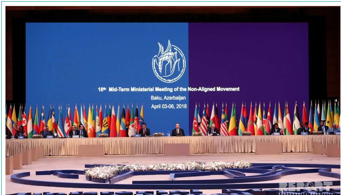
Qoşulmama hərəkəti ölkələrinin 18-ci sammiti 25 oktyabr 2019-cu il

Vətən müharibəsində qazanılan qələbəni həm də dövlətimizin dünyanın siyasi arenasında əldə etdiyi qələbədir. Siyasi qələbənin qazanılması dövlət başçısının uzun illər həyata keçirdiyi uğurlu fəaliyyətin nəticəsidir. Azərbaycan xeyli sayda beynəlxalq və regional siyasi-iqtisadi təşkilatların üzvüdür və onların həyata keçirdiyi tədbirlərdə fəal iştirak edir. Ölkəmiz bu təşkilatların keçirdiyi görüşlərin xeyli hissəsinə ev sahibliyi etmişdir.