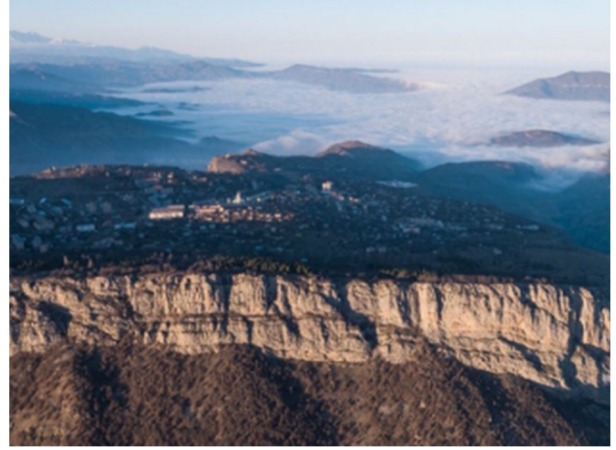
Şuşanın yuxarıdan görünüşü

2020-ci il 27 sentyabrdan 10 noyabra qədər davam edən 44 günlük Vətən müharibəsində Azərbaycanın Qarabağda yerləşən rayonları bir-birinin ardınca işğaldan azad edildi. Nəhayət ki, 2020-ci il 8 noyabr – Şuşanın azadlıq günü Azərbaycanın tarixinə şanlı zəfər günü kimi yazıldı. Həmin gün ölkə prezidenti hərbi geyimdə Şəhidlər xiyabanından bu tarixi qələbəni xalqa çatdırdı.