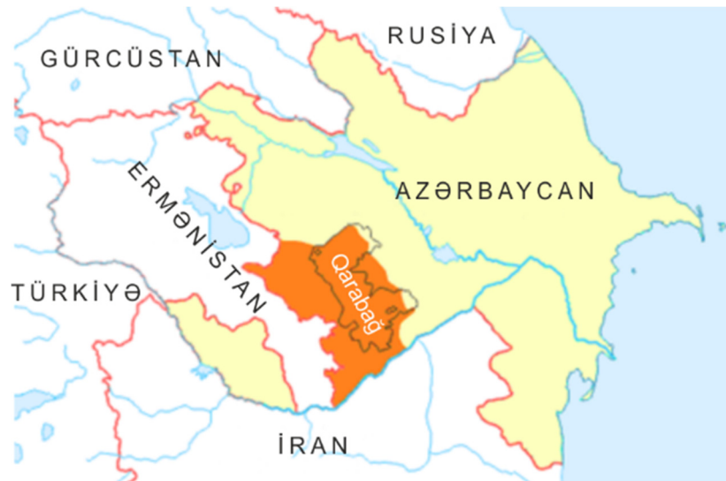
Azərbaycanın işğal edilmiş əraziləri

Nəticədə Azərbaycan ərazisinin 20 %-ə qədər Ermənistan tərəfindən işğal edildi.