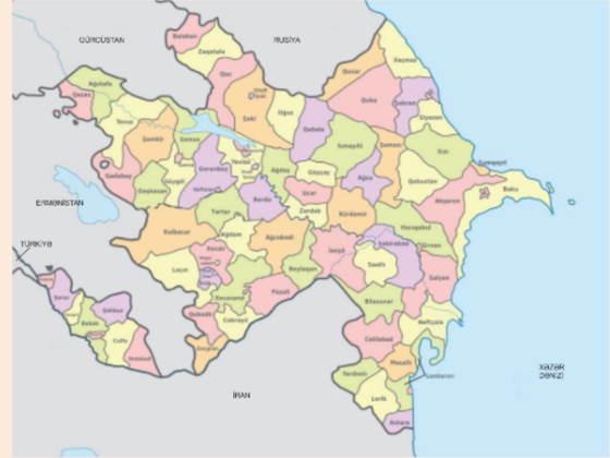
10 noyabr 2020-ci il

– 44 günlük Vətən Müharibəsinin nəticəsində ölkəmizin xəritəsində hansı dəyişikliklər baş verdi?