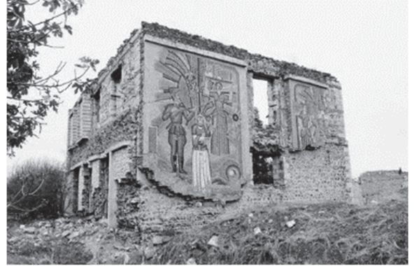
“Çörək muzeyi”. Ağdam şəhəri. işğaldan sonra

Onlar bu vəhşilikləri edərkən hesab edirdilər ki, azərbaycanlılar bir daha doğma yurdlarına qayıtmayacaqlar. Lakin bizim xalqımız ata yurduna bağlı, elinə -obasına sədaqətlidir. Doğma ocaqlarından köçkün düşən və Qarabağ arzusu ilə ürəyi çırpınan insanlarımız qısa müddətdə bu xarabalıqları cənnətə çevirəcəkdir. Bunun üçün “Böyük qayıdış” layihələri artıq həyata keçirilməyə başlanılmışdır. Çünki Qarabağ bizimdir! Qarabağ Azərbaycandır!